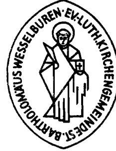
Nordelbisches Kirchenamt Göldner

Die Umschrift des Kirchensiegels lautet: Ev.-Luth. Kirchengemeinde St. Bartholomäus Wesselburen.