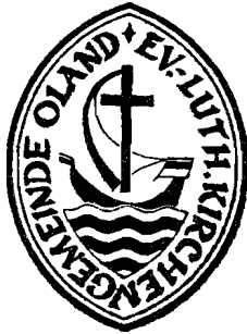
Nordelbisches Kirchenamt Göldner

Die Umschrift des Kirchensiegels lautet: Ev.-Luth. Kirchengemeinde Oland.